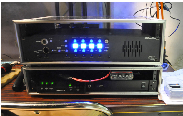
ラック下左にBS750がある。裏にアンテナが見えるが、使用されておらず、代わりに常にRBS75が使われている

ネックマイクのLNH-20Dを使用しておりますが、音質も良く長時間でも快適に装着していられます。服装にもよりますが、ベルトパックに音声スイッチがあるのでマイク部分にもスイッチがあると便利かもしれません。