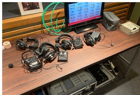
スタジオ内での運用風景 (TBS ラジオ様)