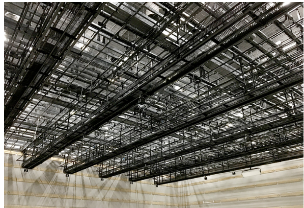
Nスタジオ上部。グリッドにRBSが取り付けられています

TBSテレビではNスタジオの改修を行う際、新たに5GHz帯を使ったワイヤレスインターカムをご検討いただき、2019年1月よりLT750システムを運用していただいています。