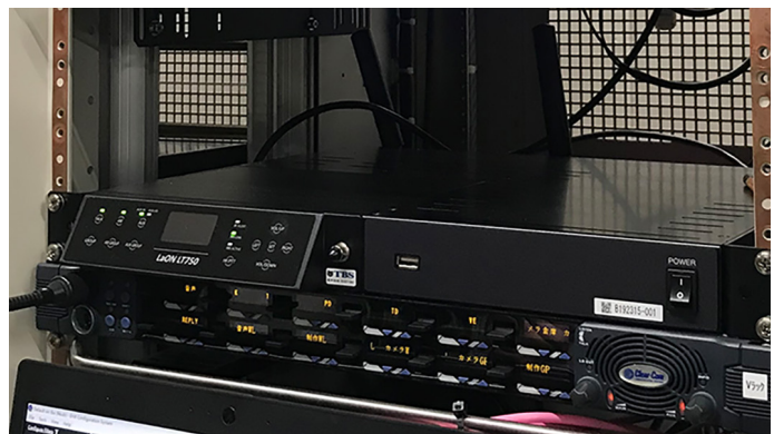
インターカムラックにマウントされているBS750