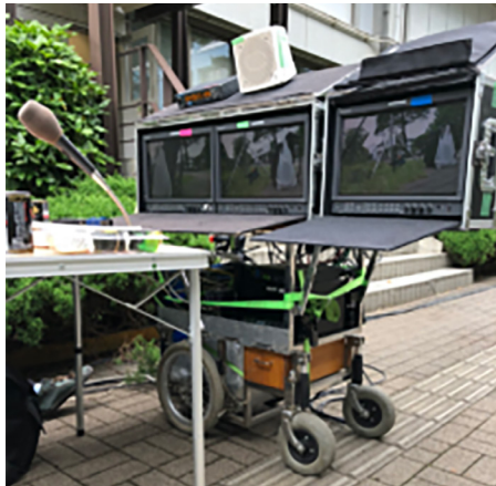
監督用のカート内に特型移動用ベースステーションが収納されています

ドラマ制作班では車載バッテリーでも駆動できる特型の移動用ベースステーションを導入いただき、機動力アップに貢献させていただいております。