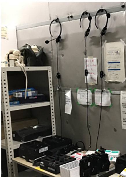
カメラマン用インターカムとして お使いいただいています