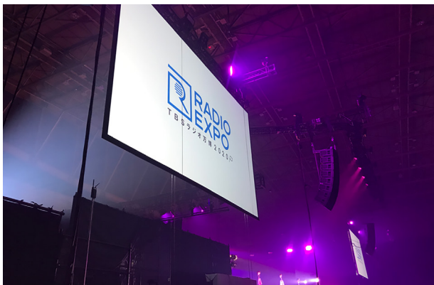
パシフィコ横浜の展示ホールBで行われたMUSIC EXPO スクリーン左下にRBSを設置しています