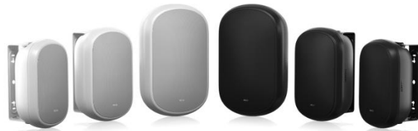
DVS 1.0 Series