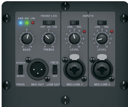
M10, M12, M15のミキサー部

内蔵の2chミキサーはMIC/LINE入力切替え可能で、ミックス出力も装備。2バンド・マスターEQ (Bass/Treble)、SPEECH/MUSIC切り替えと、100 Hzローカット・フィルター付き。